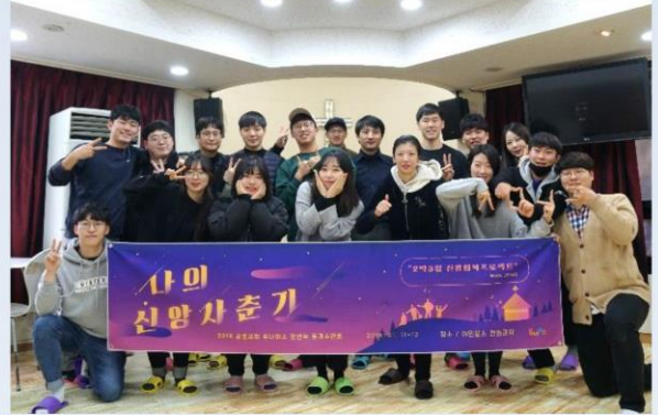
[2018 동계 수련회 나의신앙사춘기]