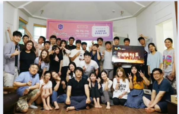
[2017 하계수련회 예수님 학교]