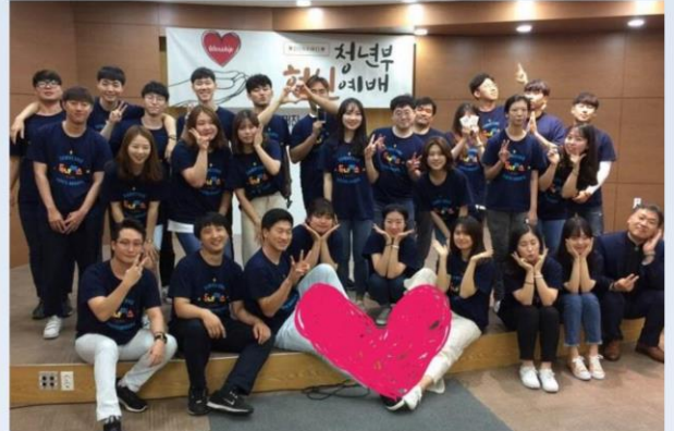
[2017 청년부 헌신 예배]

세레 요한의 때부터 지금까지 천국은 침노를 당하나 니 침노하는 자는 빼앗느니라 (마 11:12)